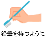
鉛筆を持つように