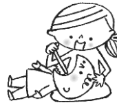
必ず大人が 仕上げ磨きをしましょう