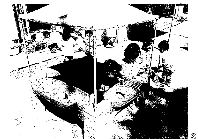
①幼児の戸外遊びの様子 ②乳児の戸外遊びの様子