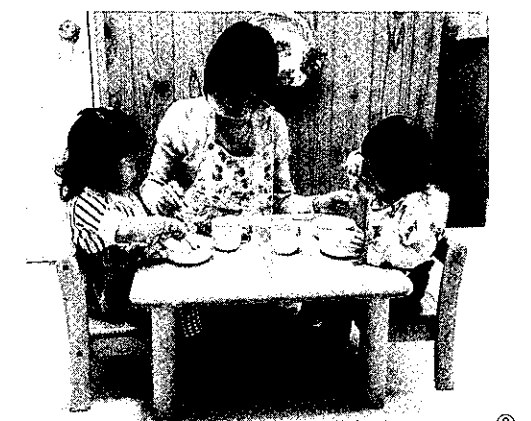
①ちょっと戻って遊びの中での経験（幼児クラス） ②乳児用の手作りおもちゃを幼児の部屋にも備えました ③1歳児の足置き台